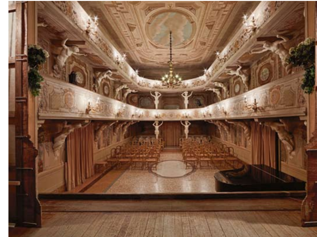
Teatro di Villa Mazzacorati-Aldrovandi, Bologna

Left Palais Garnier The Monumental Stairs