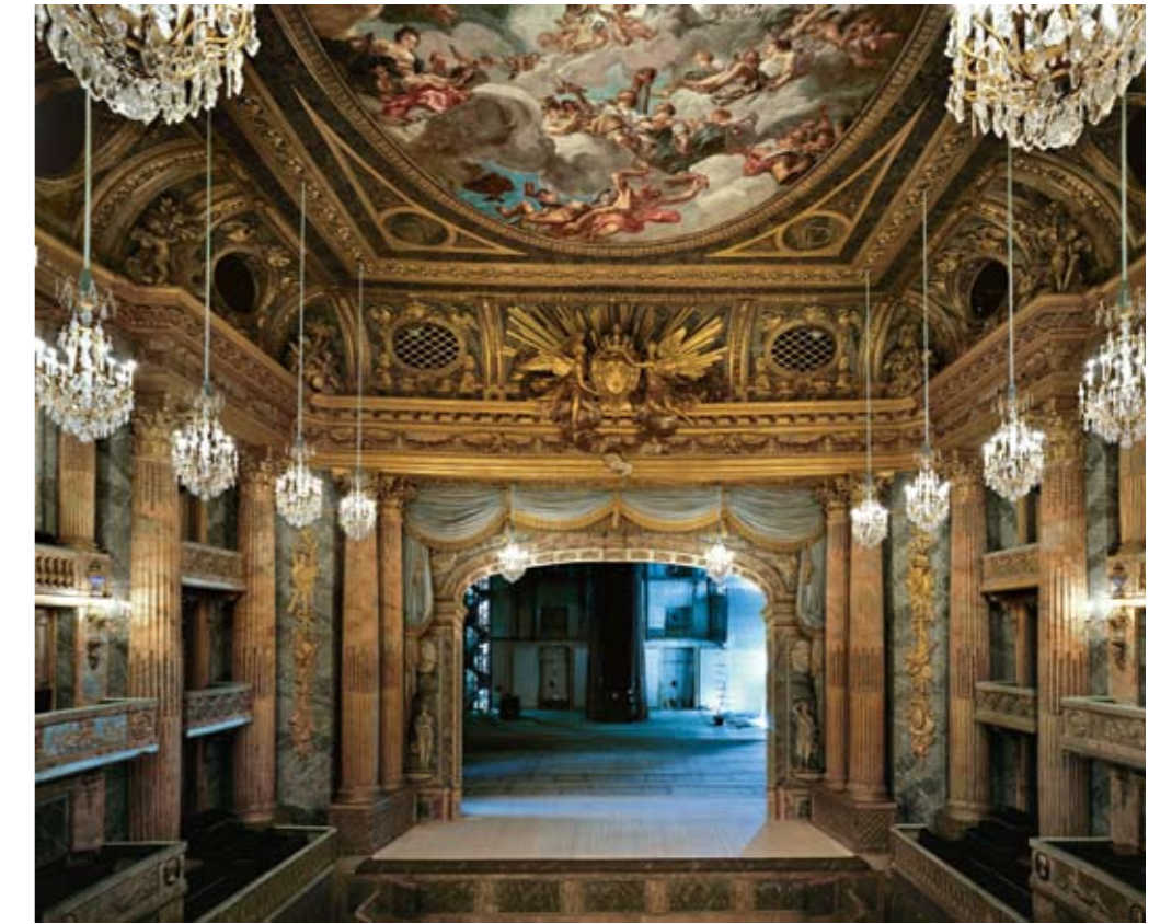
The Opéra Royal de Versailles (Royal Opera of Versailles)